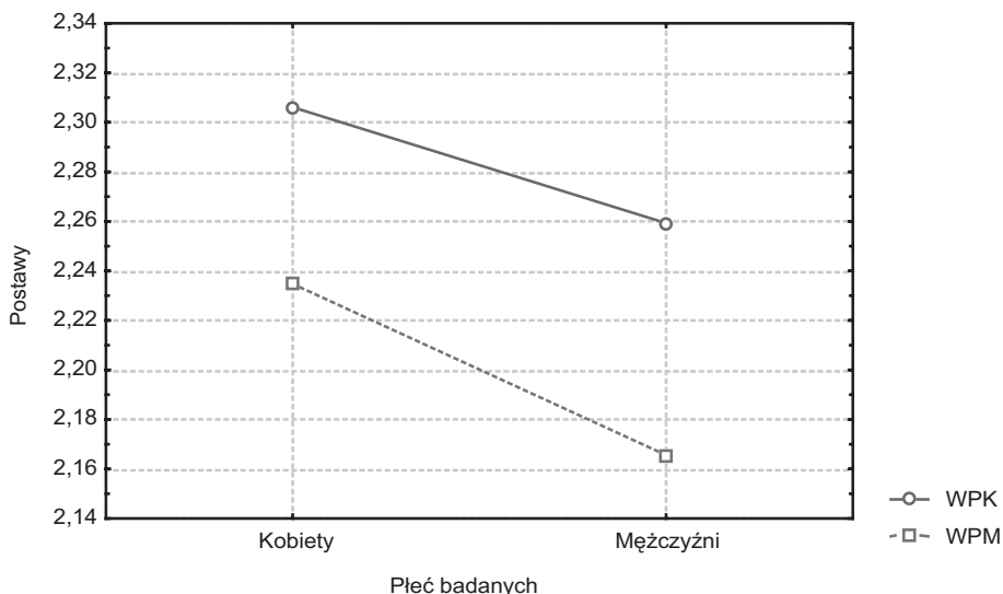
Rysunek 1. Postawy wobec polityków – kobiety (WPK) i mężczyźni (WPM) wykres średnich

Zgodnie z hipotezą o występowaniu efektu faworyzacji grupowej można było przewidywać, że ustosunkowania badanych do polityków własnej płci powinny okazać się bardziej pozytywne niż do polityków płci odmiennej. Z kolei hipoteza o stereotypizacji roli społecznej pozwalała przypuszczać, że polityk płci męskiej aktywizuje bardziej pozytywne ustosunkowania zarówno u kobiet, jak i mężczyzn niż polityk-kobieta. Testem MANOVA dokonano globalnego oszacowania ustosunkowań badanych wobec polityków obu płci, uwzględniając oba wskaźniki ustosunkowań we wszystkich warunkach eksperymentalnych. Wyniki przedstawiają odpowiednio rysunek 1 i rysunek 2.