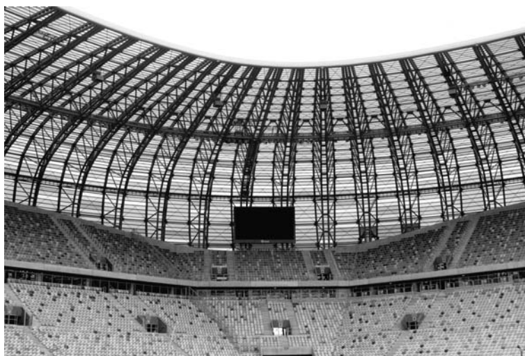
Fot. 3. Wnętrze PGE Arena z widokiem na trybuny i dźwigary

Jednym z nich będzie z całą pewnością mający powstać w 2021 r. kompleks rekreacyjny Nautilus. W jego skład wchodziło będzie oceanarium połączone z par-