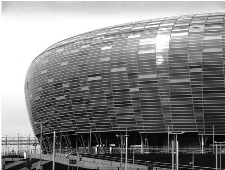
Fot. 2. Lśniąca w słońcu fasada stadionu PGE Arena

Gdańsk nie było zadaniem łatwym. Jak pisał Rasmussen: Trudność polega na tym, że dzieło architektoniczne powinno przetrwać aż w odległą przyszłość. Architekt tworzy scenografię dla długiej powoli toczącej się akcji, musi więc ona być na tyle elastyczna, by dostosować się do nieprzewidzianych improwizacji. Na etapie projektowania budynek powinien w miarę możliwości wyprzedzać swój czas, by pasował do okresu, na jaki przypadnie jego życie [Rasmussen 1999]. W przypadku budynków tak zaawansowanych technicznie i tak bardzo wpisanych we współczesny konsumpcyjny tryb życia, jak obiekty widowiskowo-sportowe tworzenie rozwiązań nowoczesnych, będących odpowiedzią na potrzeby dzisiejszego świata jest szczególnie istotne. Mało kto się zastanawia, z którymi wytworami naszej architektury społeczeństwo za sto lub dwieście lat będzie mogło nawiązać dialog. Wartością prawdziwej architektury jest bowiem to, że „żyje i mówi”. Każde pokolenie szuka swojego samookreślenia w symbolach; architektura jest takim symbolem, gdyż charakteryzuje zbiorowość twórczą i estetyczną. Potrzebujemy tego by nie stać się „pokoleniem bezbarwnym [L. Taraszkiewicz 2002].