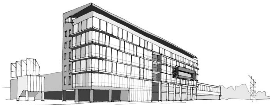
Ryc. 1. Budynek Międzynarodowych Targów Gdańskich