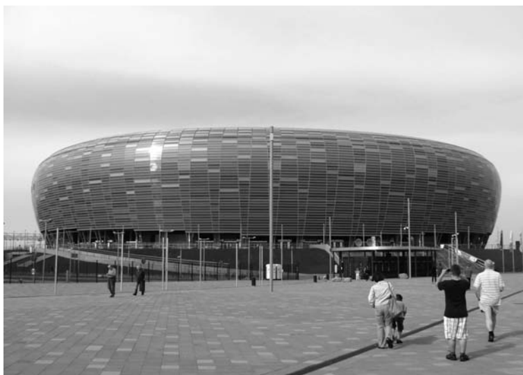
Fot. 1. Stadion Energa Arena

Fot. K. Taraszkiewicz, Gdańsk 2013 (fot. 1-3).