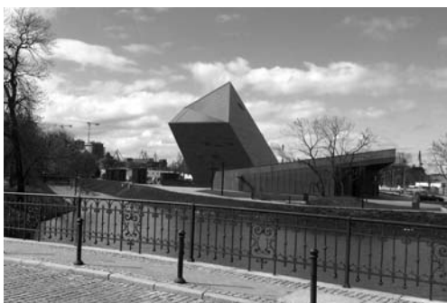
Fot. 1. Widok na Muzeum II Wojny Światowej

Innym elementem podnoszącym atrakcyjność miasta jest koło widokowe AmberSky (2013). Od momentu decyzji o jego pojawieniu się w mieście jest ono ustawiane w różnych miejscach, takich jak Targ Węglowy, Wyspa Spichrzów a obecnie Ołowianka. Nowe lokalizacje pozwalają nie tylko na obserwację miasta z różnych punktów widoko-